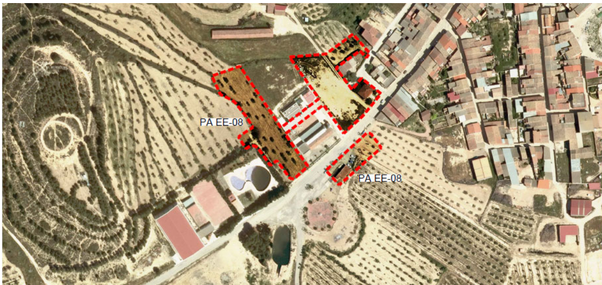
Situació de l'àmbit

En aquest àmbit es concretarà la qualificació del sòl com a sòl urbà no consolidat i la ordenació, a partir de la definició d'un Polígon d'actuació urbanística, de tal manera que pugui ser immediatament executat, en resposta a l'actual situació i la demanda de sòls per a poder edificar habitatges com a millora i compleció garantint d'aquesta manera que les actuals necessitats de la població municipal.